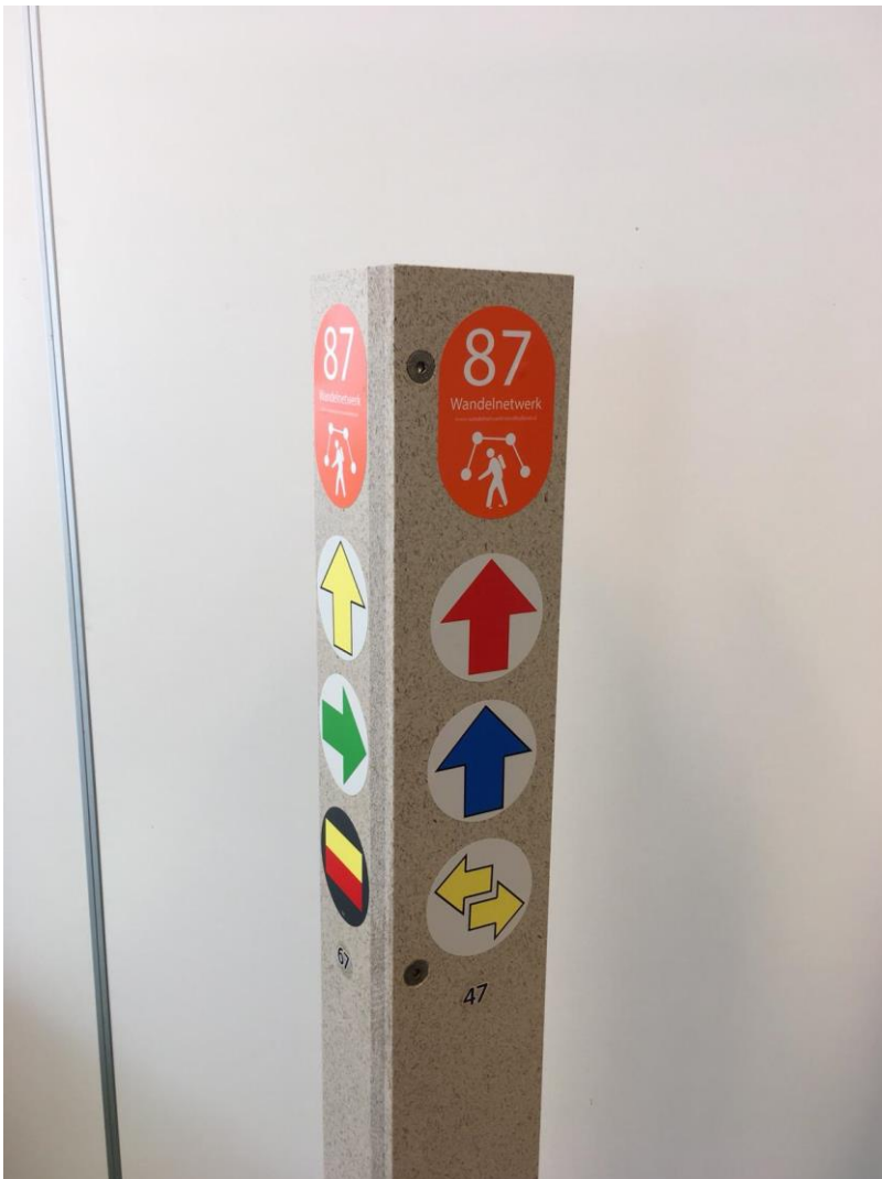
De Gooi en Vechtstreek wil via Circulair Inkoop het hele toeristische wandelroutenetwerk bewegwijzeren met 100% circulaire routepalen

Een aantal gemeenten heeft al een start gemaakt met circulair inkopen, waardoor er goede voorbeelden van geslaagde aanbestedingen voorhanden zijn. Van een MRA-brede aanpak is echter nog geen sprake. Indien deze afstemming tussen de 36 partners van de grond komt, geeft dit een belangrijke impuls aan het ontwikkelen van een omvangrijk circulaire inkoopprogramma.