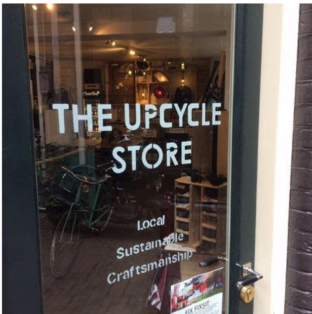
The Upcycle Store in Amsterdam

Startpunt voor iedere werkgroep vormen de grondstoffenstromen waarvan de gemeente eigenaar is via de inzameling van huishoudelijk afval en het onderhoud en beheer van de openbare ruimte. De context per grondstofstroom loopt echter uiteen, evenals de samenwerkingspartners en de uitdagingen. Daarom zal de voortgang per stroom verschillen.